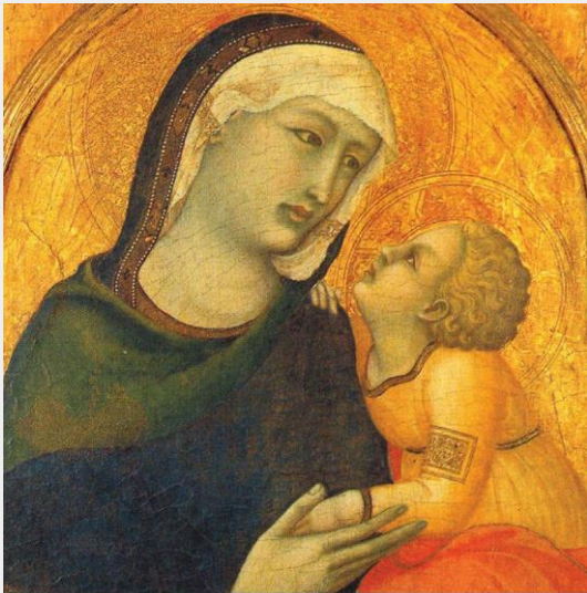
Pietro Lorenzetti, Madonna col Bambino, 1310-1320 PIENZA - Palazzo Borgia - Museo Diocesano