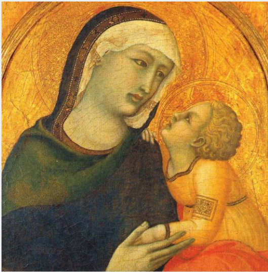
Pietro Lorenzetti, Madonna col Bambino , 1310-1320 PIENZA - Palazzo Borgia - Museo Diocesano