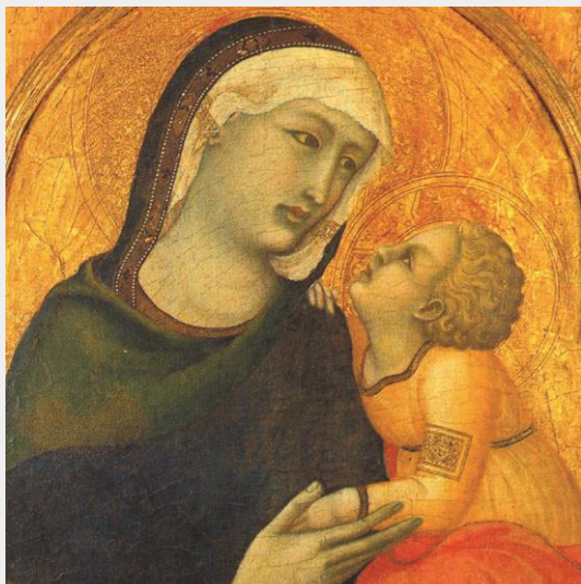
Pietro Lorenzetti, Madonna col Bambino , 1310-1320 PIENZA - Palazzo Borgia - Museo Diocesano