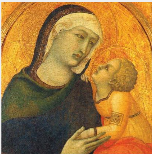
Pietro Lorenzetti, Madonna col Bambino, 1310-1320 PIENZA - Palazzo Borgia - Museo Diocesano