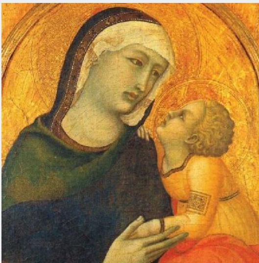
Piero Lorenzetti, Madonna col Bambino, 1310-1320 PIENZA - Palazzo Borgia - Museo Diocesano