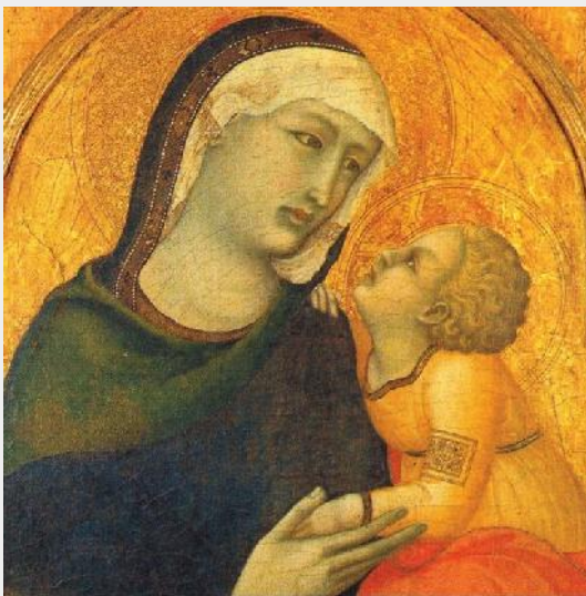
Pietro Lorenzetti, Madonna col Bambino, 1310-1320 PIENZA - Palazzo Borgia - Museo Diocesano