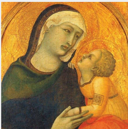
Pietro Lorenzetti, Madonna col Bambino , 1310-1320 PIENZA - Palazzo Borgia - Museo Diocesano